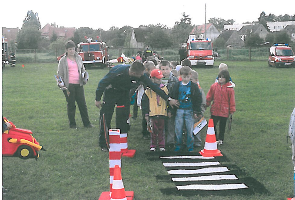
Rys. nr 6 Program edukacyjny prowadzony przez Policję Powiatową dla dzieci na stadionie miejskim w Karlinie.

Straż Miejska w Karlinie ze współpracą Policji i Straży Granicznej realizują program „Razem Bezpieczniej”. Celem programu jest wykształcenie w uczniach Szkół Podstawowych na terenie gminy umiejętności samodzielnego i rozważnego uczestnictwa w ruchu drogowym jako pieszego i pasażera poprzez przedstawienie uczniom określonych informacji tj. do przestrzegania i rozumienia podstawowych zasad ruchu drogowego oraz kształtowanie takich podstaw, nawyków i umiejętności zachowania się w sytuacji zagrożenia, które stanowiąc będą podstawę odpowiedzialnego i kulturalnego zachowania się w ruchu drogowym.