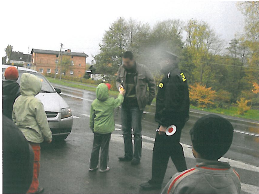
Rys. nr 8 Przebieg akcji „Jabłko czy cytryna” na drodze krajowej nr 6 w Malonowie

Głównym celem akcji jest poprawa bezpieczeństwa w okolicy szkół oraz uświadomienie kierowcom, że potencjalne ofiary ich nieostrożnej akcji nie są anonimowe. Postawienie kierowcy twarzą w twarz z dziećmi, wysłuchanie nagany z ich ust i zjedzenie cytryny odnosi znacznie większy skutek psychologiczny niż dziesiątki mandatów.