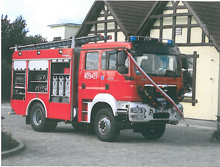
Rys. nr 3 Zakupiony dla OSP w Karlinie specjalny samochód ratowniczo - gaśniczy