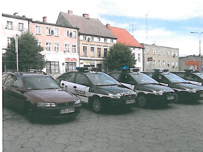
Rys. nr 1 Samochody Policji Powiatowej dofinansowane ze środków Gminy Karlino

Gmina aktywnie współpracuje też z Ochotniczą Strażą Pożarną finansując utrzymanie jednostek OSP w Karlinie, Daszewie i Domacanie zapewniając tym samym ich gotowość bojową, a także ponosi koszty zakupu samochodów bojowych, sprzętu, finansuje akcję ratownicze oraz remonty i inwestycje w remizach strażackich.