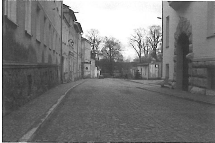
Rys. nr 5 Przebudowana ulica Waryńskiego w Karlinie