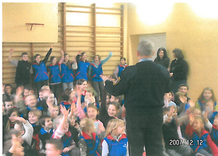
Rys. nr 7 Zajęcia edukacyjne prowadzone przez Straż Miejską w Szkole Podstawowej w Karścinie.

W ramach uświadomienia młodych ludzi prowadzona jest corocznie przy współpracy Powiatowej Komendy Policji akcja „jabłko czy cytryna”.