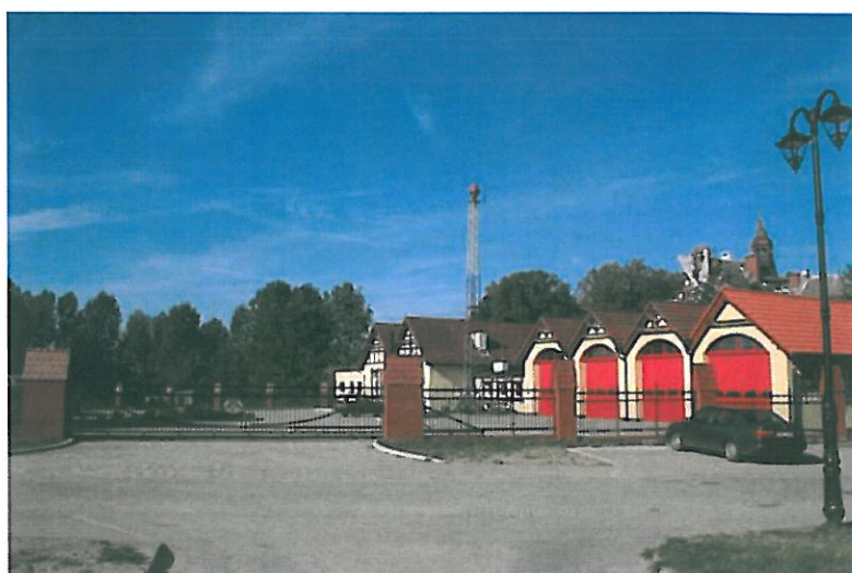
Rys. nr 2 Przebudowana ulica Prusa oraz zagospodarowanie terenu Ochotniczej Straży Pożarnej w Karlinie.

Gmina aktywnie współpracuje też z Ochotniczą Strażą Pożarną finansując utrzymanie jednostek OSP w Karlinie, Daszewie i Domacanie zapewniając tym samym ich gotowość bojową, a także ponosi koszty zakupu samochodów bojowych, sprzętu, finansuje akcję ratownicze oraz remonty i inwestycje w remizach strażackich.