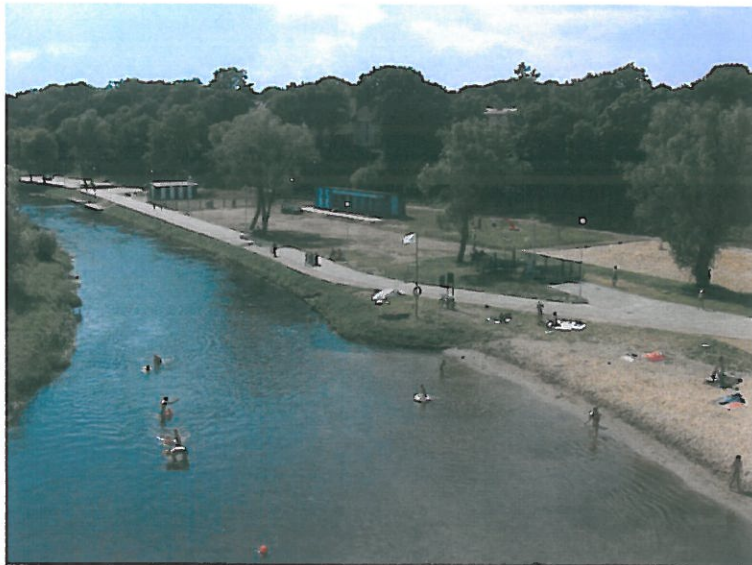
Rys. nr 4 Widok ul. Nadbrzeżnej w Karlinie po wykonaniu przebudowy drogi